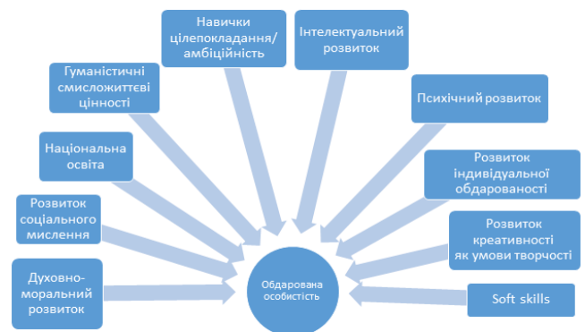
Рис. 1. Схематичне зображення розвитку особистості в лідерській парадигмі

обдарованості, здійснення успішної, бажано інноваційної, діяльності, спрямованої на розвиток вітчизняного соціально-економічного простору. З цією метою на освіту обдарованої особистості потрібно дивитися ширше, ніж у межах вузькоокреслюваних і нині надзвичайно популярних напрямів освіти обдарованих. Погляд на обдаровану особистість, від якої очікують досягнень, інновацій, громадянської свідомості, національної ідентичності тощо підштовхує до досягнення ширшого та глибшого розуміння мети й завдань розвитку обдарованої дитини.