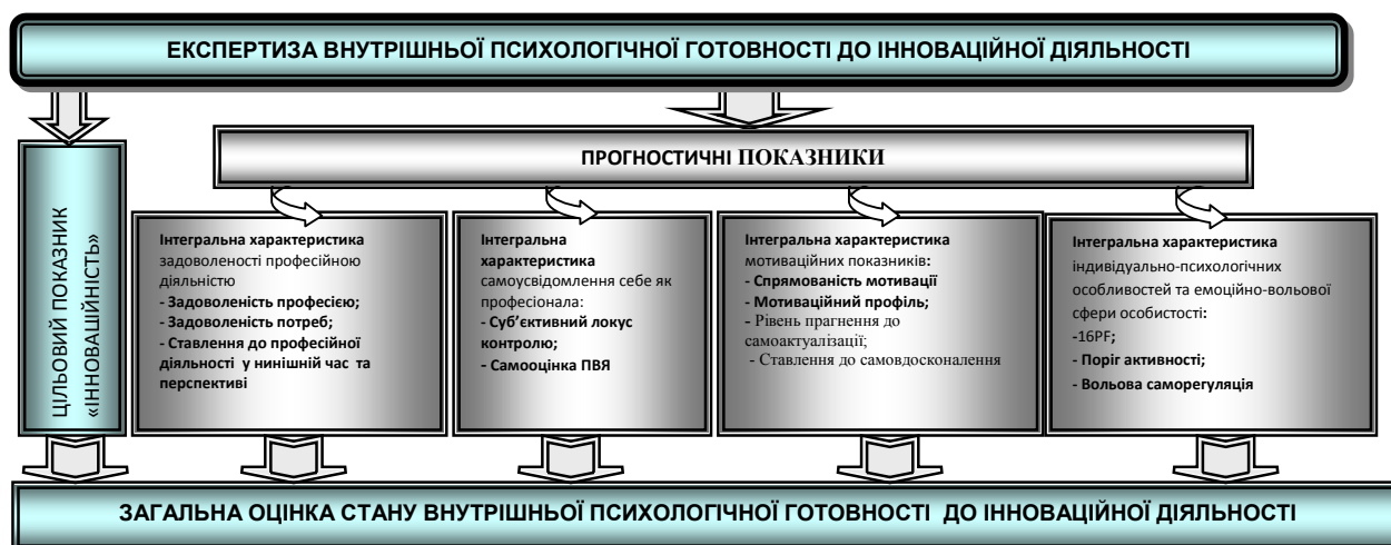
Рис. 1. Модель експертизи внутрішньої психологічної готовності персоналу освітніх організацій до інноваційної діяльності

У цій публікації предметом детального обговорення є висвітлення загального дизайну, алгоритму,