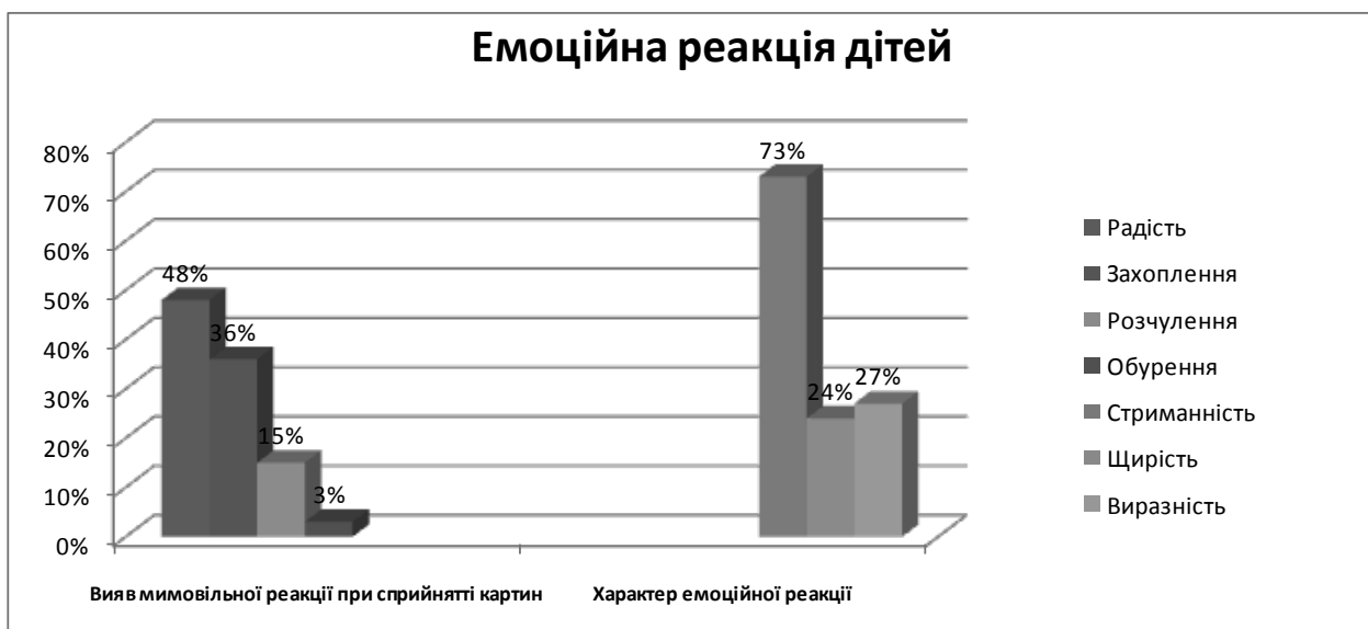
Рис. 2. Емоційна реакція дітей

Після розгляду картини Миколи Пимоненка «Курця», діти (100 %) змогли висловити власну позицію щодо картини, зазначили, що вона їм подобається. Однак чітко обґрунтувати ставлення до картини змогли лише 22 % опитаних, висловлюючись так: «я люблю тварин», «картина нагадує мені село і мою бабусю, яка там живе», «мені подобається, тому що на картині намальовані маленькі каченята». Також 60 % опитаних не змогли чітко пояснити власну позицію. Ці діти вдавались до пояснень типу: «мені подобається ця картина, тому що вона гарна». Решта дітей (18 %) не змогла пояснити, чому їм подобається картина.