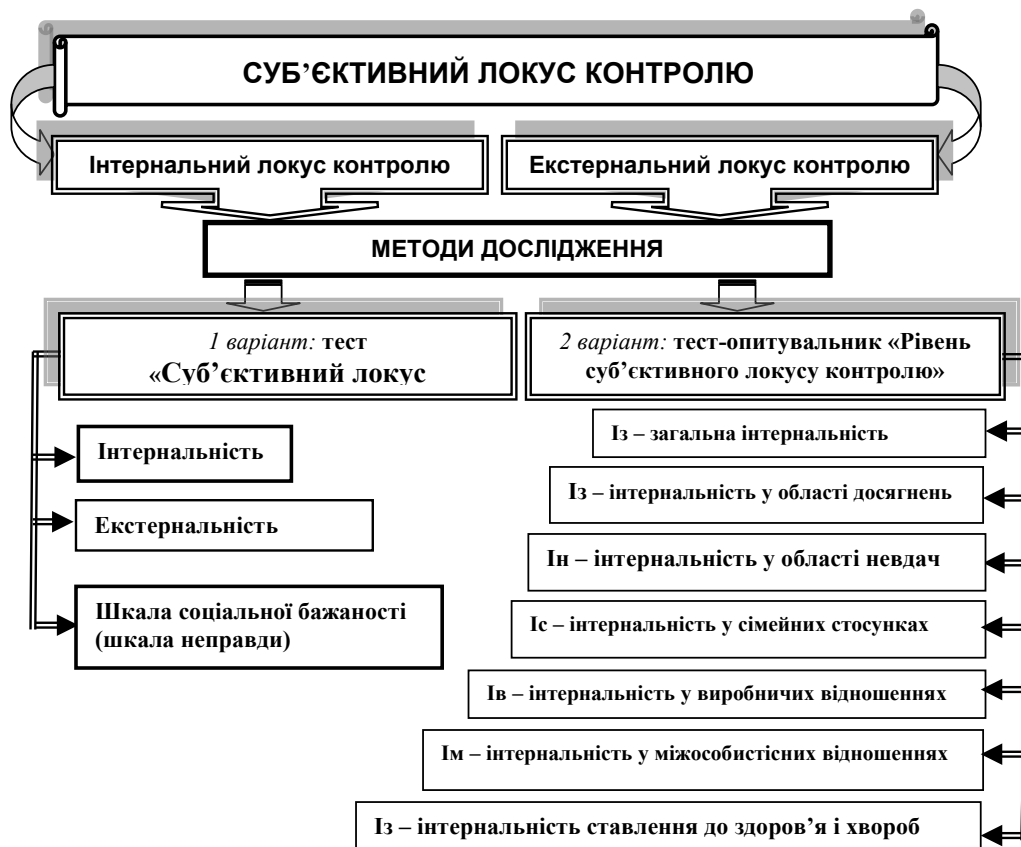
Рис. 3. Модель алгоритму дослідження «суб'єктивного локусу контролю»

«самоусвідомлення себе як персоналу» («Сам»), що є критерієм сформованості психологічної готовності до інноваційної діяльності й конкурентоздатності особистості [1–7; 17; 18]. На рисунку 3 показано модель алгоритму дослідження «суб'єктивного локусу контролю».