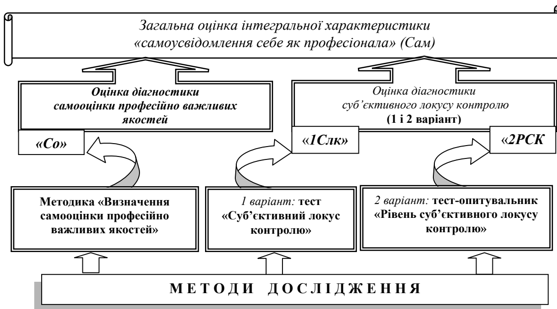
Рис. 2. Модель дослідження ставлення особистості до себе як професіонала та алгоритм визначення інтегральної характеристики «самоусвідомлення себе як професіонала»

■ визначення відповідальності людини за власні вчинки та життя, а також готовності до активності.